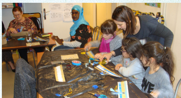
Accueil de Loisirs, Centre Social Vigneron, Taverny

Le souhait est de rendre les parents et les enfants acteurs de leurs loisirs au sein du centre social et de les réunir pour des projets comme la réalisation du char et des costumes pour le Festival du Cinéma par exemple.»