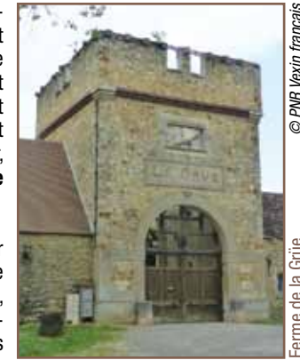
Ferme de la Grüe.

À partir du parking, entrer dans le bois et tourner à droite avant la barrière. Atteindre la fontaine Saint-Clair ①. Revenir sur le chemin et tourner à droite, puis continuer tout droit. Au carrefour en forme de fourche, bifurquer à gauche. Plus loin, laisser un chemin sur la droite et continuer tout droit. Au carrefour suivant, virer vers la gauche en suivant le grand chemin. Prendre le premier chemin à gauche, continuer tout droit en laissant plus loin un étang sur la gauche. Au premier carrefour, continuer tout droit, 180 m plus loin, tourner à gauche vers la ferme de la Grüe ②.