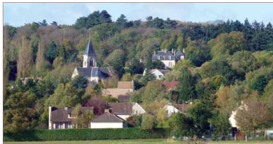
Le village de Frémainville.

• fontaine Saint-Clair • bois de Galluis • ferme de la Grüe • table de lecture du paysage • château • église Saint-Clair