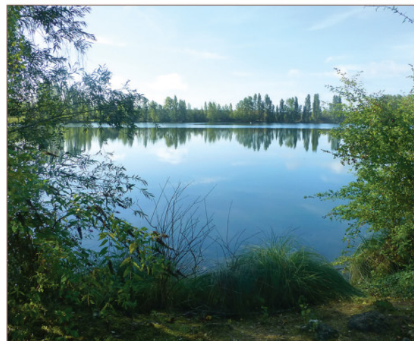
Étang de l'Illon