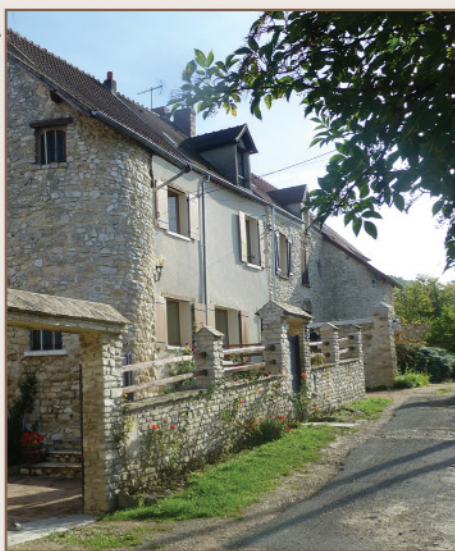
La Grande Cour