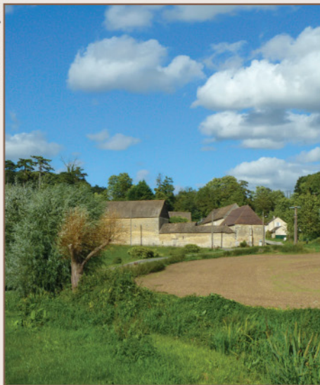
Vue sur Estrééz