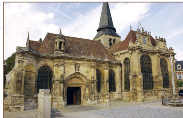
Église Notre-Dame de la Nativité

Dos à l'église, emprunter la rue Notre-Dame puis la rue de la Paix. Prendre à gauche le passage Lefèvre, tourner à droite et emprunter immédiatement à droite le passage Huré. Passer sous le porche et déboucher, à gauche, sur la place Potiquet où se trouve la plaque sur le cinéma 12. Gagner à droite la place de la Halle 13. Suivre la rue Carnot sur 20 m ; tourner à gauche au niveau du bar puis gagner le petit passage entre deux bâtiments. Au bout de la ruelle, monter à gauche la rue pavée jusqu'à la place d'Armes 14 et poursuivre par la rue de Paris ; passer les deux piliers 15 et rejoindre le point de départ.