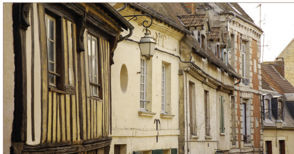
Rue de l'Hôtel-de-Ville

• hôtels particuliers et maisons médiévales • Aubette de Magny • Blamécourt • église Notre-Dame • piliers de la ville