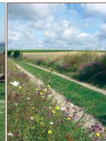
Vallée de l'Aubette.

FFRandonnée Les chemins, une richesse partagée www.ffrandonnee.fr