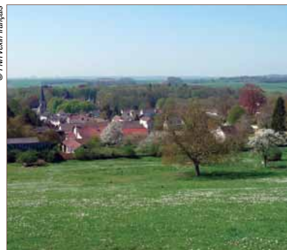
Vue sur le village de Vigny.