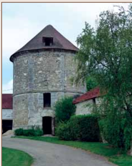
Ferme du Colombier.