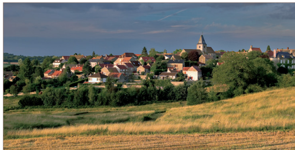
Vue générale d'Omerville

FFRandonnée Les chemins, une richesse partagée www.ffrandonnee.fr