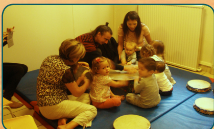
«Eveil Musical» (Centre Social Vincent Vigneron, Taverny)

PERSAN, VENDREDI 18 NOVEMBRE PARENTS / ENFANTS-ADOS