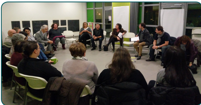
«Bien être à l'école»