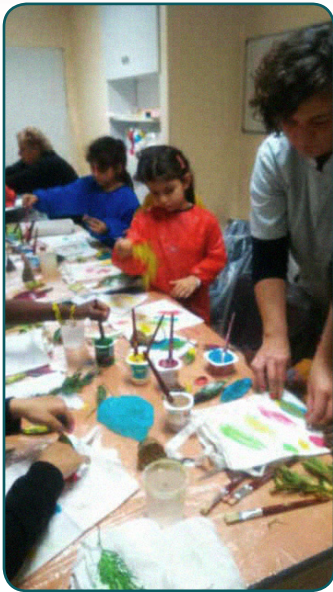
«Graines de Curieux» (Maison des Familles, Deuil-la-Barre)

Association les P'tits curieux de Saint Clair - Pour en savoir plus : lesptitscurieux.desaintclair@gmail.com - 06 19 35 26 87