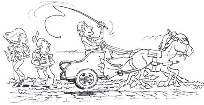
LA VOIE ROYALE PARIS-ROUEN

1 De l'église de Nucourt, passer sous le porche. Devant le calvaire, bifurquer à gauche, puis emprunter le premier chemin à droite menant à Nucourt village. Au bout, tourner à droite, rue de l'Arche, puis à gauche, rue de Magny. Environ 100 m plus loin, prendre à droite la rue du Château. Tourner à droite sur la D 206.