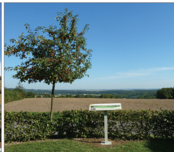
Table de lecture du paysage

FFRandonnée Les chemins, une richesse partagée www.ffrandonnee.fr